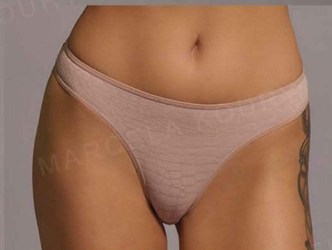
11246 PACK X3 VEDETINA DE MESH JACKARD "JENNIFER" T. ÚNICO - SURTIDO BLANCO-NEGRO-NOUGAT