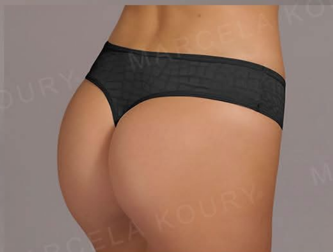
12246 PACK X3 CULOTTELESS DE MESH JACKARD "JENNIFER" T. ÚNICO - SURTIDO BLANCO-NEGRO-NOUGAT